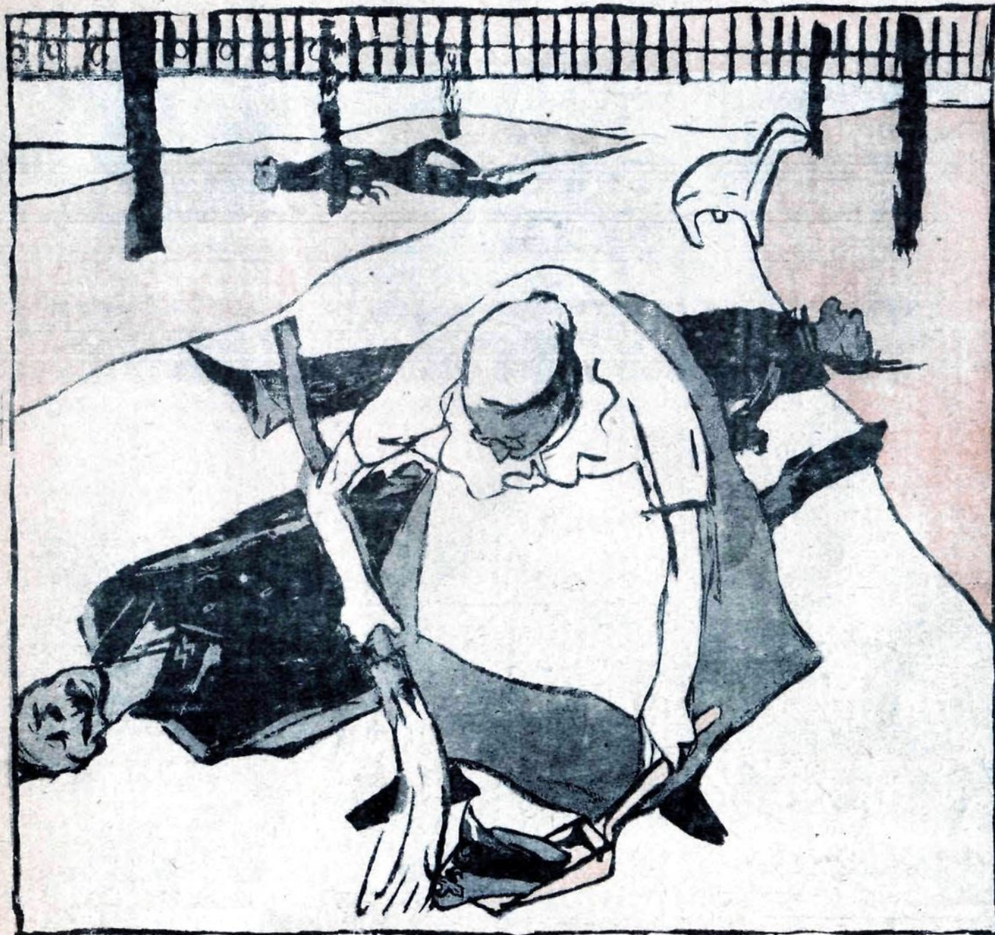
— Спасибо, голубчики! Опять насорили!