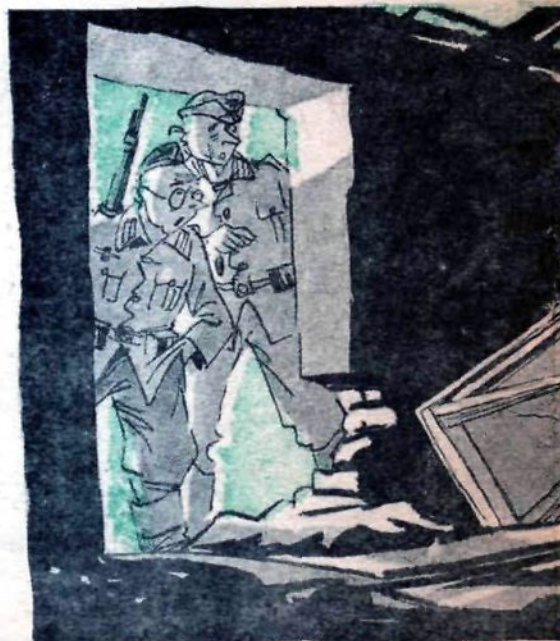
Рис. Б. Клипча

— Посмотри, Карл, снаряд разорвался. — А деньги целы? — По несчастливой случайности. В кармане обер-лейтенанта.