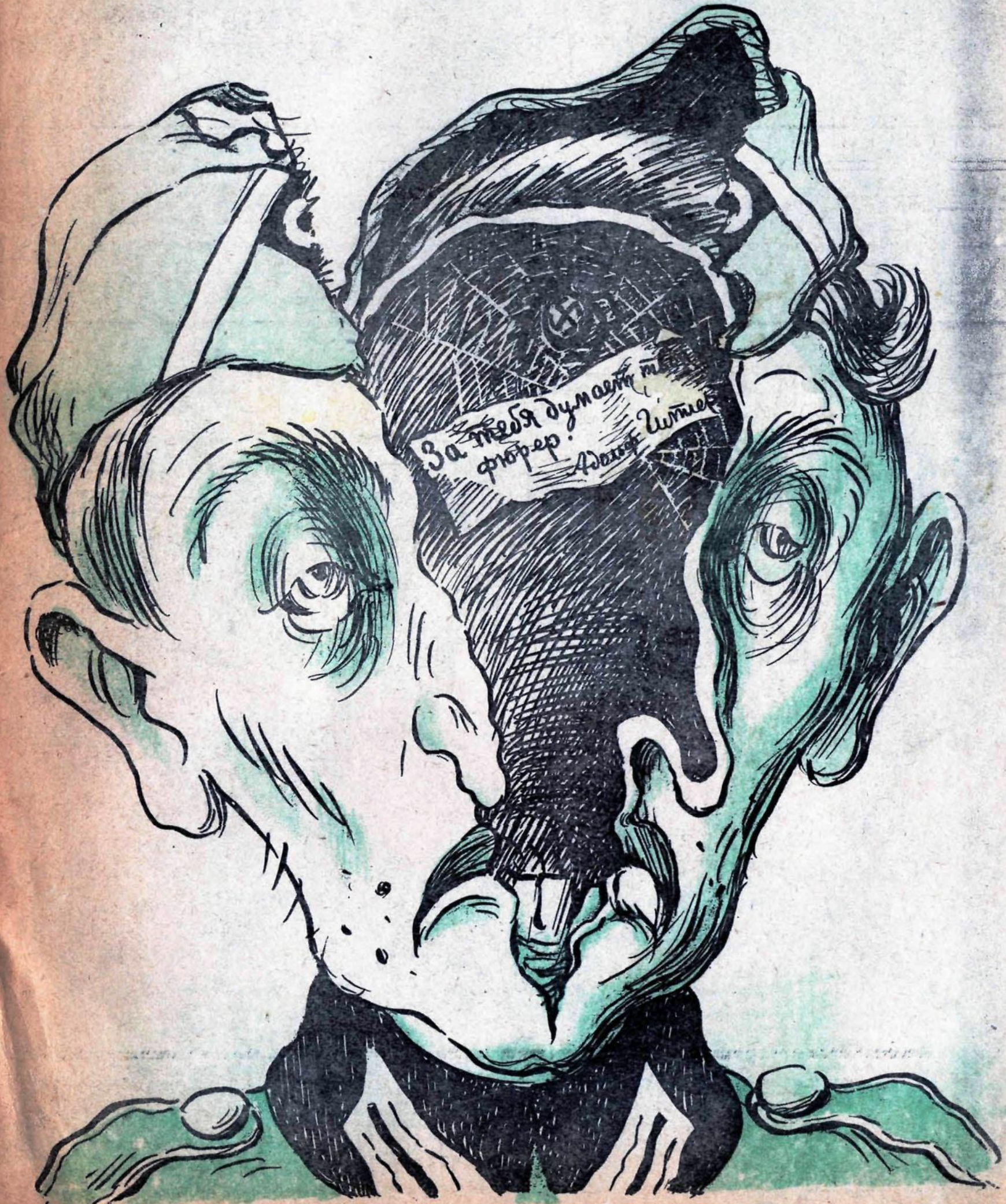
Разрез головы немецкого солдата *