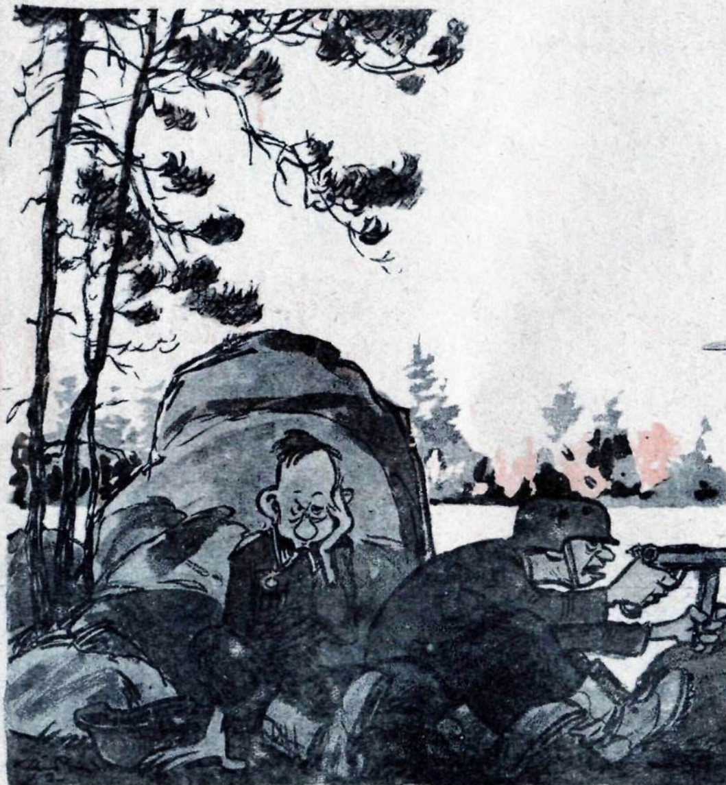
Рис. К. Елисеев

— Ох, и дерутся финские солдаты!.. — Разве ты ходил с ними в атаку? — Причем тут атака? Вчера подрался с одним финским солдатом.