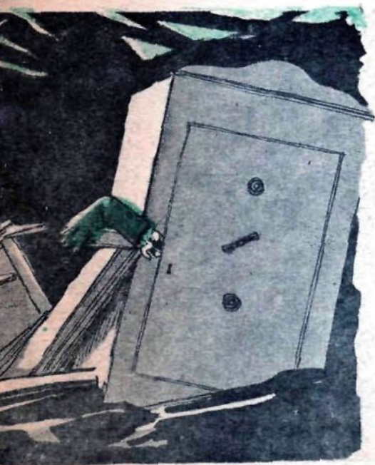
орвался юкколо полковой кассы.