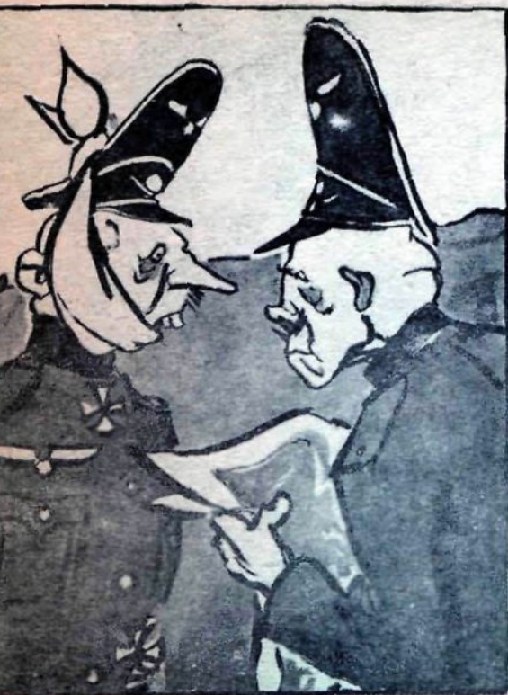
олнении, господин генерал!